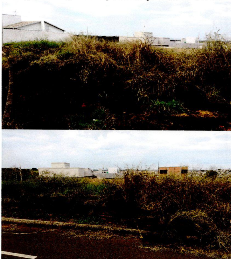
Figura 3 – Registro fotográfico da queimada no lote 116